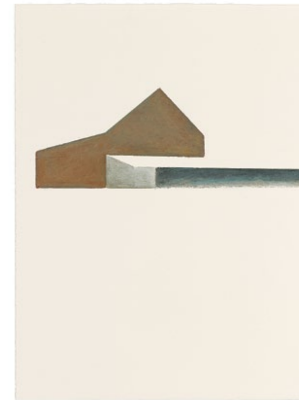
Katrin Berger 2006 Ölkreide auf Papier 320 x 240