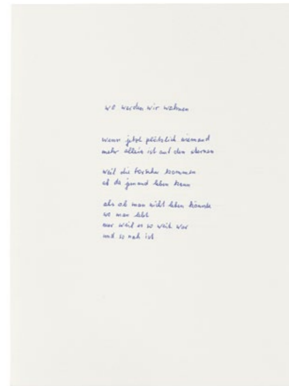
Käte Reiter wo werden wir wohnen · 2006 Kugelschreiber auf Papier 320 x 240