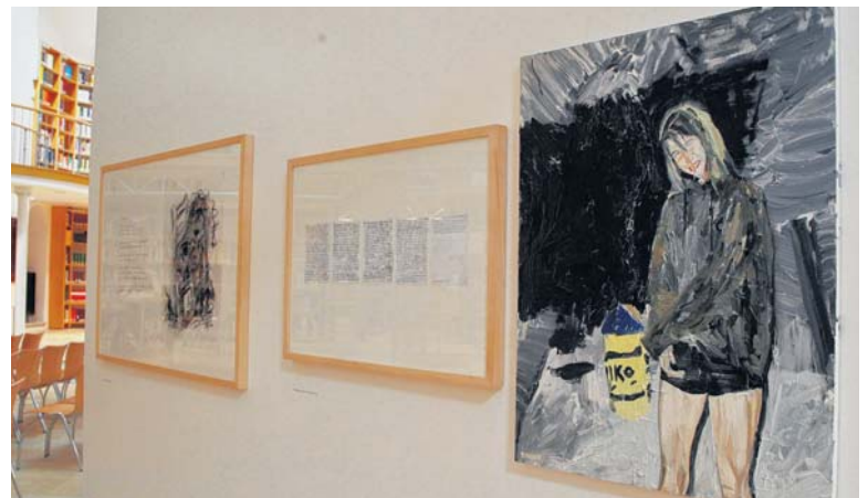
Das Gemälde (rechts) stammt von Thomas Hoor und steht im Dialog zu einem Text von Wolfgang Bleier.