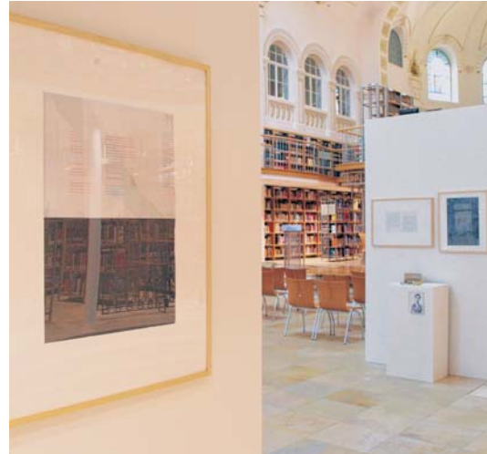
Blick in die Ausstellung im Kuppelsaal.