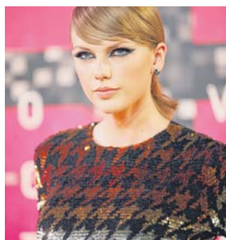
Taylor Swift ist bei den American Music Awards mit sechs Nominierungen im Rennen.

LOS ANGELES. Taylor Swift (25) geht mit sechs Nominierungen als Favoritin ins Rennen um die American Music Awards. Die amerikanische Popsängerin könnte die Musiktrophäen unter anderem in den Sparten „Künstler des Jahres“ und „Song des Jahres“ gewinnen. Swift hat seit 2008 bereits 16 AMA-Trophäen gewonnen.