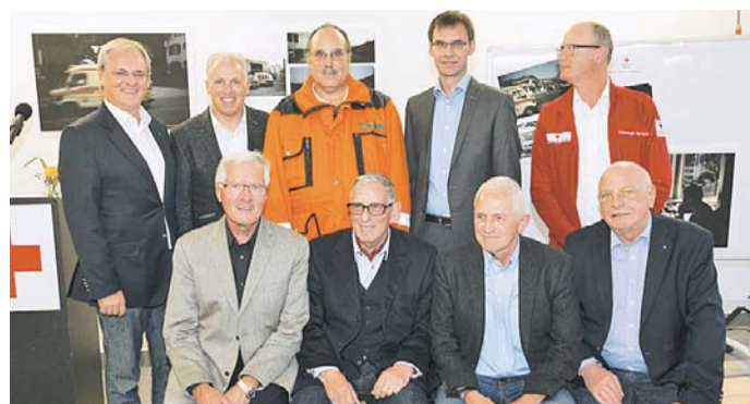
Wichtig sei es, den Einsatzkräften die nötige Infrastruktur und die erforderliche Ausrüstung zur Verfügung zu stellen, betonte Wallner.